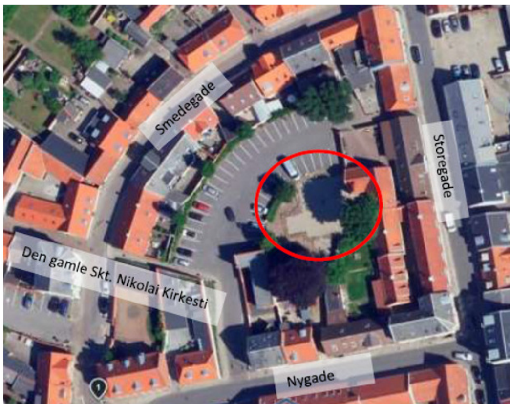
Illustration 1. Projektområde

I den gamle Varde købstad - klemt inde imellem Smedegade, Storegade og Nygade - ligger resterne af Skt. Nikolaj Kirke; i dag markeret ved store sten, der markerer grundridset af kirken (Se illustration 1).